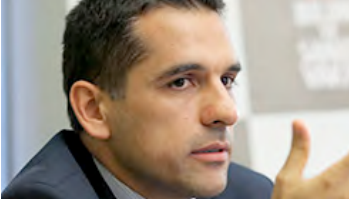
Ahmet Yükleven Avrupa'da Yerellenen İslam: Almanya ve Hollanda'daki Türk Müslüman Cemaatleri