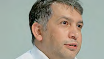
Bayram Sinkaya "Arap Baharı" Sürecinde İran'ın Bölge Politikası