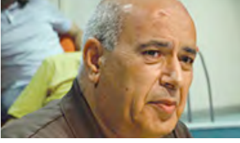
Sabri Orman Kur'an ve İktisat: Kredi ve Faiz Meselesine Makro-Sistemik Bir Yaklaşım