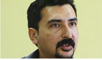
Taşansu Türker Osmanlı ve Rus Modernleşmesi: Tarihten Günümüze Yansımalar