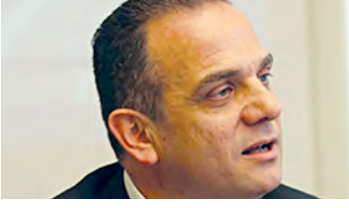
Ali Dumankaya Gayrimenkul Sektörüne Bakış: Bir Kurumsallaşma Örneği Dumankaya